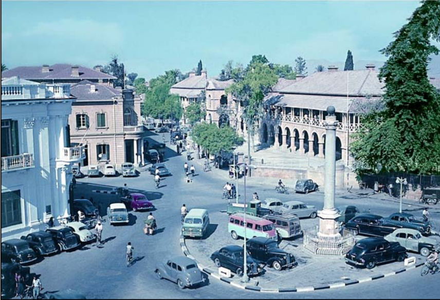
1955 Sarayönü - Lefkoşa. Altay Sayıl'ın bastırduğu kartpostal örneklerinden. (10x15 cm)