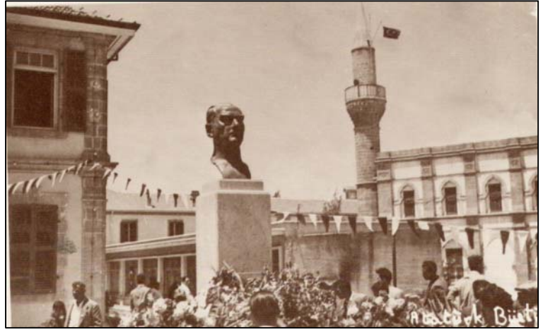
Solda Yeni Yıl Tebrik Kartı (8x13) ve sağda Evkaf avlusunda bir kutlama gününde Atatürk Büstü'nün görünümü (8x13). (Foto Şık'ın hazırladığı foto kartlardan, Lefkoşa.)

Sultan II. Mahmut Kütüphanesi- Lefkoşa. (6x9 cm). (Foto Şık'ın hazırladığı foto kartlardan, Lefkoşa). Nazif Bozathlı Koleksiyonu.