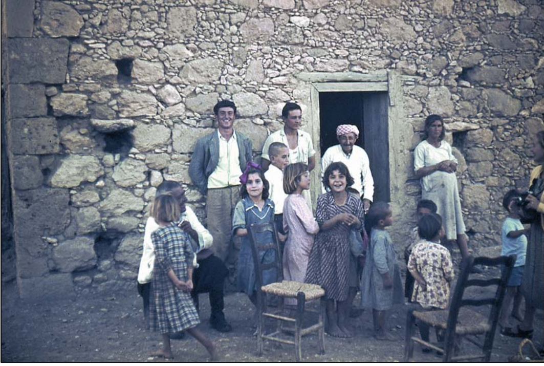
1955 yılında Beşparmak köyü Girne– Kuzey Kıbrıs. (Kartpostal, renkli 10x15 cm. - Altay Sayıl)