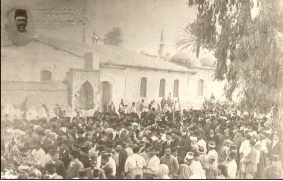
1917 yılında Lefkoşa'da Türk fotoğrafçılardan Ahmet Şevki'nin bastırıldığı kartpostallardan biri. Fotoğrafın sol üst köşesinde eski Türkçe yazıda "Üç bin lirayı aşan tüm servetini Mekteb-i İdadi'ye vakfeden büyük misafirperver İrık Derviş Efendi. 27 Mart 1917 tarihinde yapılan cenaze töreni. Foto: Ahmet Şevki" yazmaktadır. (8x13 cm) (Mekteb-i İdadi eskiden liselere verilen ad.)

Ayrıca, KKTC Posta İdaresi'nin 1981 yılında, Atatürk'ün doğumunun 100. yıldönümü anısına bastırıldığı ve değeri 5 TL olan ilk resmî posta kartı ve diğer posta kartları vardır.